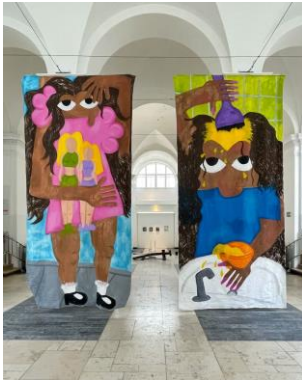
Ximena Ferrer Pizarro: Homemade blonde, 2023, Acryl auf Leinwand, 470 x 230 cm