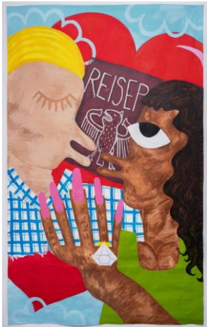
Ximena Ferrer Pizarro, El amor de mi visa (Love of my visa), 2024, Acryl auf Leinwand, 350 x 200 cm

© Ximena Ferrer Pizarro, Foto: Ximena Ferrer Pizarro