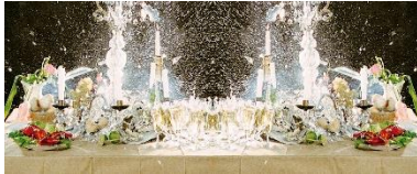
Gabriella Gerosa, Das Buffet (Buffetcrash), 2003, Videoinstallation für Beamerprojektion, Ex. 3/5, Größe variabel, © und courtesy the artist.