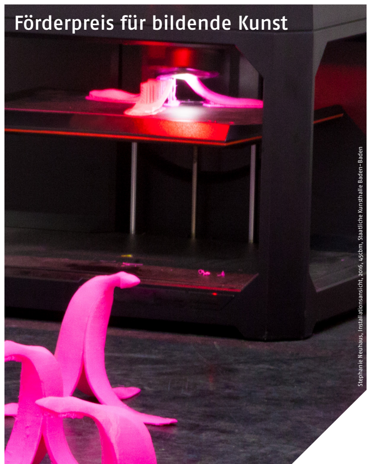
Stephanie Neuhaus, Installationsskizze, 2016, 050cm, Staatliche Kunsthalle Baden-Baden

Ausschreibung Einsendeschluss: 31.7.2017