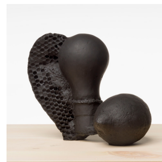
Michael Sailstorfer | *1979 C-Batterie 7 | 2023 Bronze (Unikat)