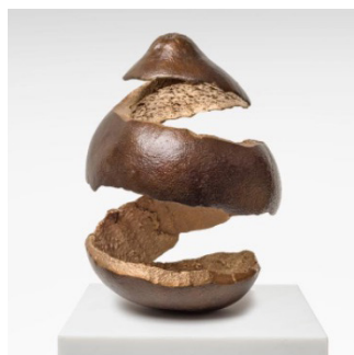
Alicja Kwade | *1979 CitrusQuantum | 2023 Bronze, Marmor; edition of 24+3AP