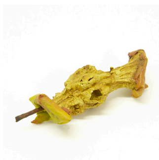
Gavin Turk | *1967 Gala (eaten apple) | 2011 Bronze, bemalt, Unikat