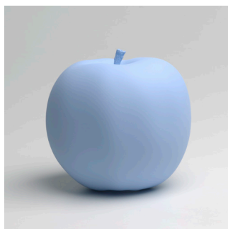
Katharina Fritsch | *1956 Apple | 2009-10 Schnellgießharz, Farbe, handbearbeitet Edition Parkett 4/48