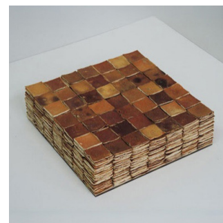
Werner Henkel | *1956 o.T. (vegetabile Objekte) | 2014 Orangenschalen, geschnitten