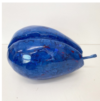
Maruša Sagadin | *1978 Blaue Lippen I | 2024 Acrylharz, Styropor, Pigmente, Metall, Lack